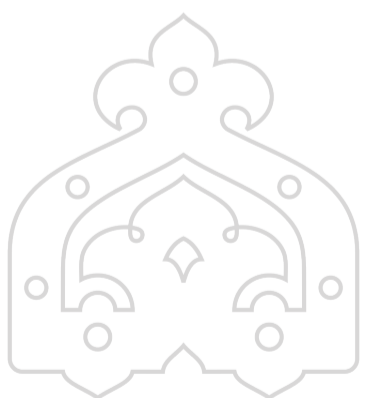
مسابقه ملی طراحی زیورآلات

نشانی دبیرخانه: تهران تقاطع خیابان آزادی و یادگار امام (ره)، وزارت میراث فرهنگی، گردشگری و صنایع دستی، معاونت صنایع دستی و هنرهای سنتی، اداره کل آموزش و ترویج. شماره تماس: ۶۱۰۶۳۴۲۱، ۶۱۰۶۳۴۱۹، ۶۱۰۶۳۷۱۷ و ۶۱۰۶۳۴۲۹